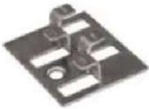
Grapa para tarimas premium

Importante: Siempre sigue las instrucciones del fabricante de la tarima para elegir los tipos y tamaños correctos.