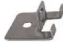
Grapas de terminación