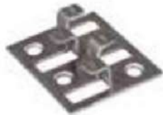
Grapas Classic y Densum